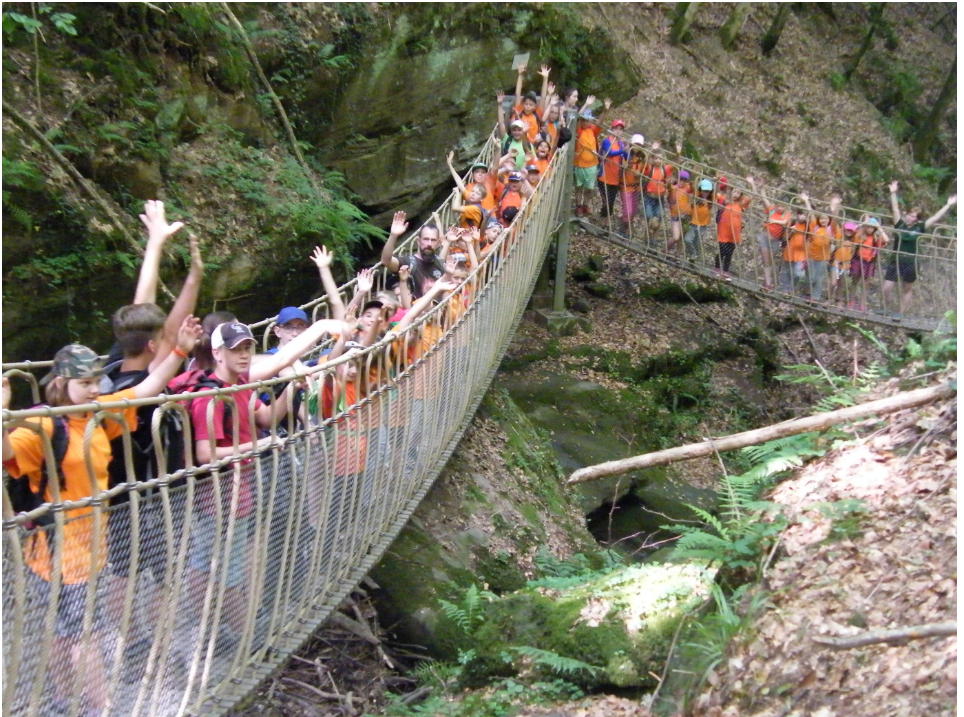
Hängebrücke oberhalb der Wasserfälle in Kordel