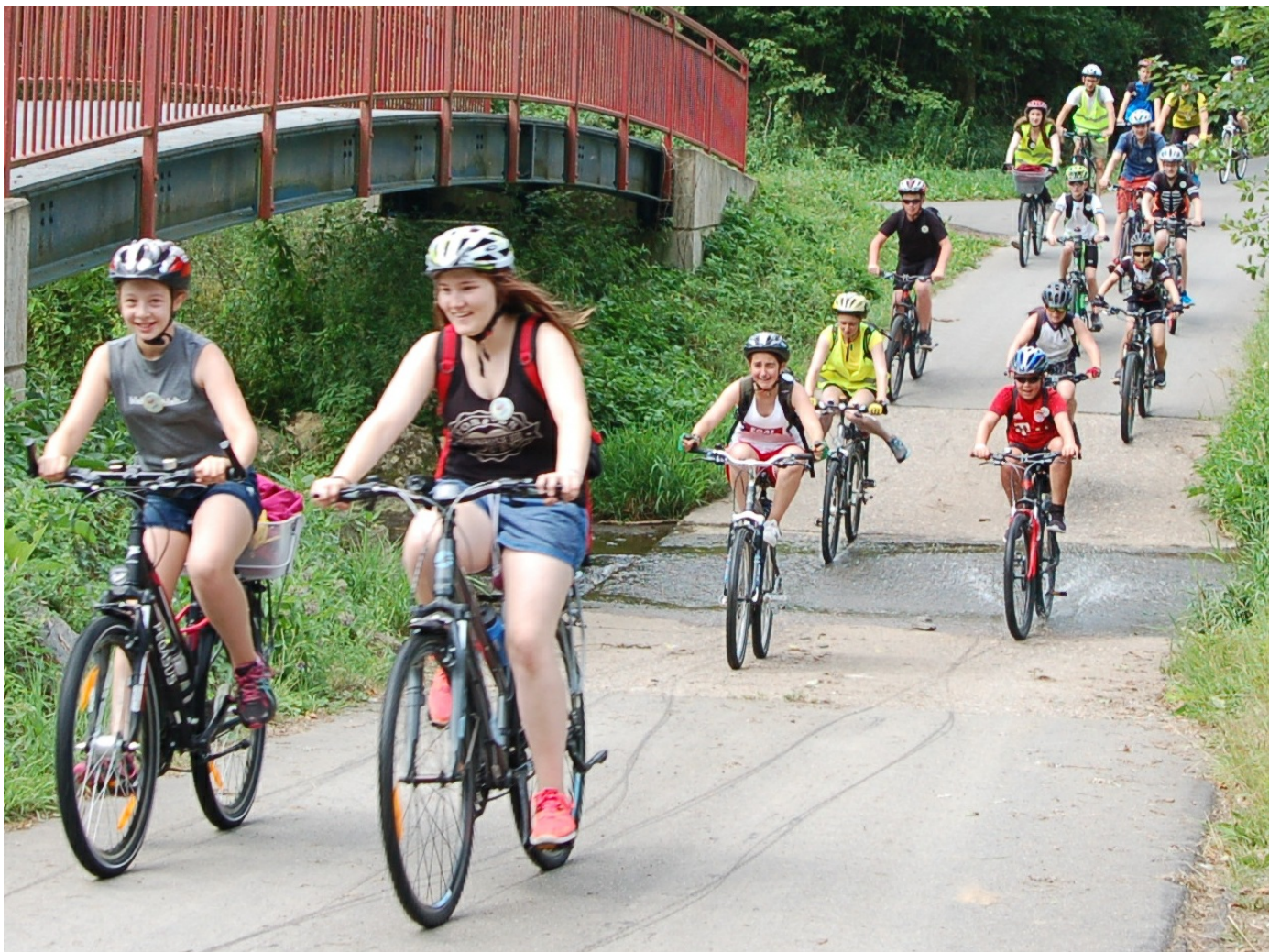
Haus der Jugend